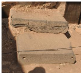
Рис. 5. Ваммаһ