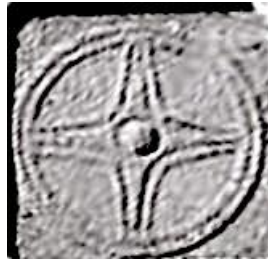
Рис. 13 Солярный символ