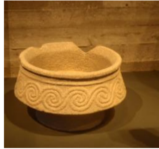
Рис. 7. Микенская чаша