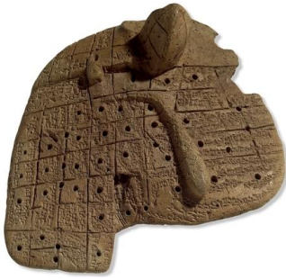
Рис. 6. Модель печени