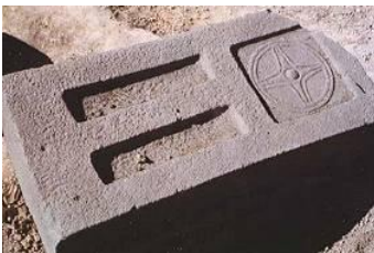
Рис. 10. Алтарь для ладана