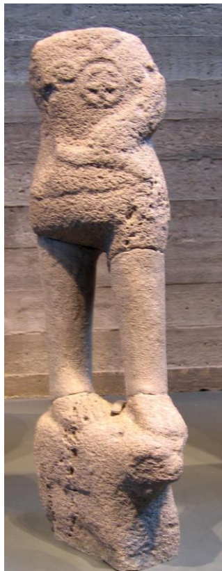
Рис. 14 Статуя божества