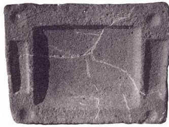
Рис. 11. Стол для приношений (вид сверху)