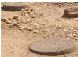
Рис. 4. Основания колонн