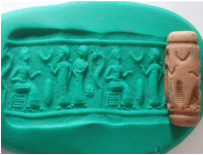
Рис. 12 Митаннианская печать