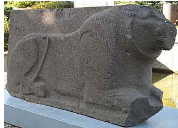
Рис. 9. Ортостас-лев