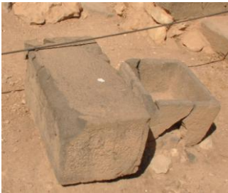
Рис. 8. Базальтовые ортостасы