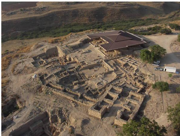
Рис.1. Общий план тела